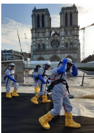
Descontaminación por plomo en Notre Dame de París