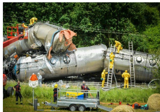
Descarrilamiento de un convoy ferroviario de ácido fosfórico