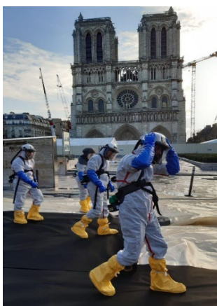
Décontamination au plomb à Notre Dame de Paris