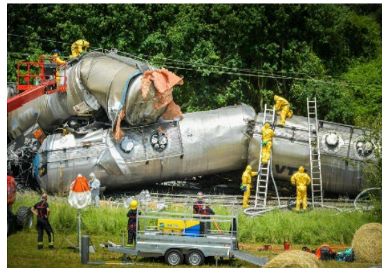
Déraillement d'un convoi ferroviaire d'acide phosphorique