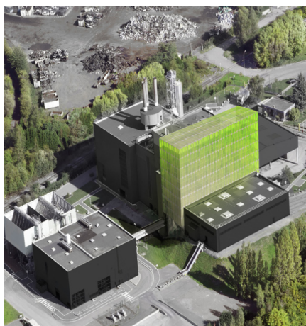
Rendu 3D d'une biofaçade placée sur une centrale d'incinération de déchets (X-TU Architects)