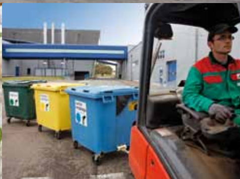
Gestion déléguée des déchets