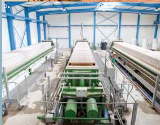
1, 2, 3. Gestion des boues et effluents industriels